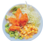
208-Ebi Poke Bowl sushi rijst met gefrituurde garnalen, edamame avocado ijsbergsla mais japanse mayonaise teriyaki saus seasoning mix tempura crispy.