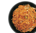
255-Fried Noodles /gebakken noodles vega