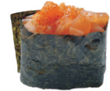
221-Spicy Salmon /zalm tartare