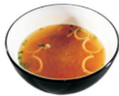
201-Miso Soup sojaboensoep met stukjes tofufu