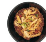
254-Fried Rice met Chicken /gebakken rijst met kippendijen