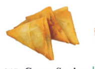
245-Curry Spring /kerrie loempia's 3st