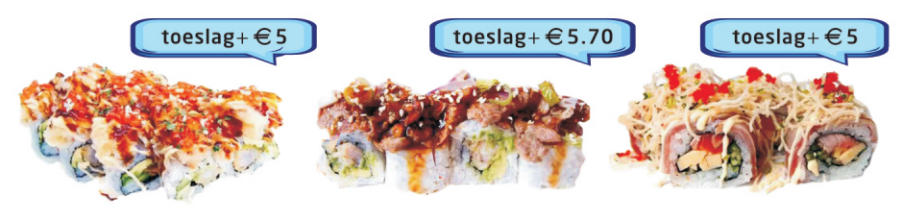
289-Double Dragon Roll 4st. sushi met gefrituurde tempura black tiger garnalen lling, topping van tempura black tiger garnalen en viskuiten met een unagi, kewpi en teriyaki saus 290-Surf and Turf Roll 4st. sushi met gefrituurde tempura black tiger garnaal soft shell van krabsalade en geflambeerde beef, topped met gebakken uien, cocktail en unagi saus 291-Deluxe Roll 4st. sushi met zalmfilet, tamago en komkommer vulling, geflambeerde tonijnfilet, topped met tobiko, fied noodles, peterselle flakes en kewpi