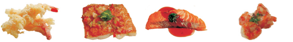
264-Tempura Black Tiger Prawns/gefrituurde garnalen 2st 265-White Fish /witvis met knoflookboter 266-Salmon/zalmfilet met teriyaki saus 267-Ebi Chili /pikante garnalen