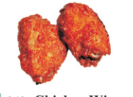
248-Chicken Wings /kipvleugels 3st.