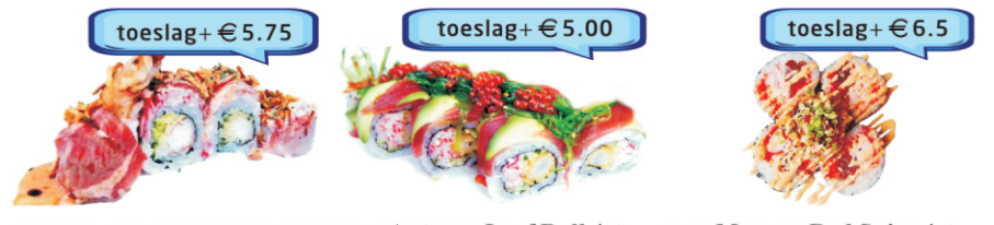
295-Classic Surf & Turf Roll 4st. sushi met gefrituurde gamba en avocado vulling, geflambeerde beef met zoete teriyaki sesam glaze 296-Autumn Leaf Roll 4st. sushi met gefrituurde gamba, krabsalade en komkommer vulling, soft shell van verse tonijnfilet en avocado, topped met viskruit, wakame en japanse caeser dressing 297-Maguro Red Spice 4st. sushi krabsalade, tonijntartaar, tempura, tobiko vulling, topping van pikante tonijntartaar, bosui, tobiko, chili mayonaise.