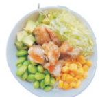
209-Kipfilet Chirashi Bowl sushi rijst met gegrilde kippendijen, edamame avocado ijsbergsla mais japanse mayonaise teriyaki saus seasoning mix.