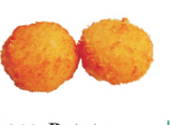
246-Potato /aardappelkoekjes 2st