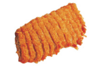
250-Fried Chicken Breast/gefrituurd kip