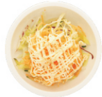
204-Crabmeat Salad krab en viskuiten salade