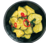
202-Pickled Cucumber zoetzure komkommer