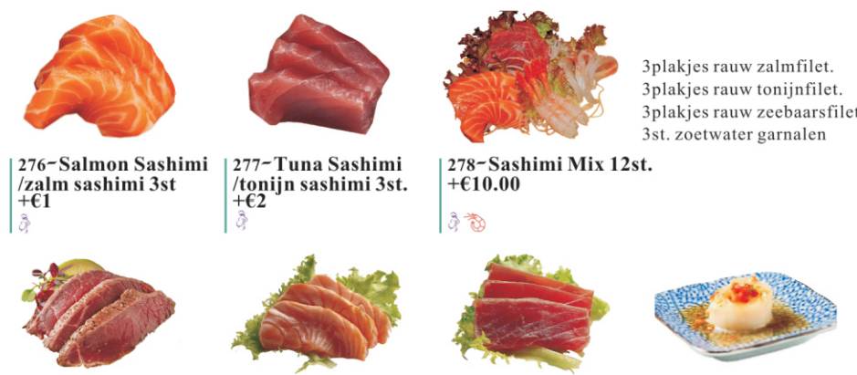
276-Salmon Sashimi /zalm sashimi 3st +€1 277-Tuna Sashimi /tonijn sashimi 3st. +€2 278-Sashimi Mix 12st. +€10.00 279-Beef Tataki/licht gegrilde bief+€1 280-Salmon Tataki /licht gegrildezalm +€1 281-Tuna Tataki/licht gegrilde tonijn +€2.5 282-Coquille +€2