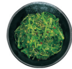
206-Wakame +€1.50 portie losse wakame