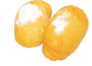
252-Banana Katsu /gebakken banana 2st.