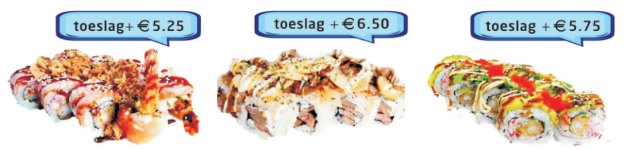
292-All Surf Roll 4st sushi met gefrituurde gamba, tempura crispy, krabsalade en komkommer vulling, soft shell van geflambeerde zalmfilet, topped met gebakken uien, sesam en teriyaki saus. 293-Philly Steak Roll 4st sushi met gebakken ossenhaas, roomkaas vulling, topping van gegrilde ribeye, gebakken champignons, uien en jong belegen kaas, topped met knoflook saus en Japanse mosterd. 294-Soft Shell Shrimp Roll 4st. sushi met deepfried shrimp, komkommer en krabsalade vulling, soft shell van avocado, topped met tobiko, unagi, kewpi, bosui