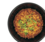
253-Fried Rice /gebakken rijst vega