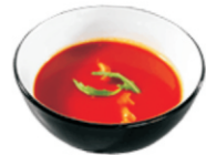
200-Tomato Soup tomatensoep