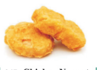
247-Chicken Nuggets /kipnuggets 3st