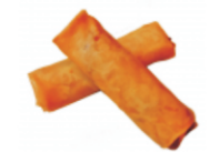
251-Spring Roll /mini loempia's (veg) 3st