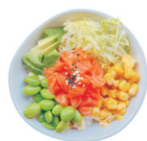
207-Zalm Poke Bowl sushi rijst met vers zalmfilet, edamame avocado ijsbergsla mais japanse mayonaise teriyaki saus seasoning mix.

1p,p indien u meer wilt €2.00 extra per stuk