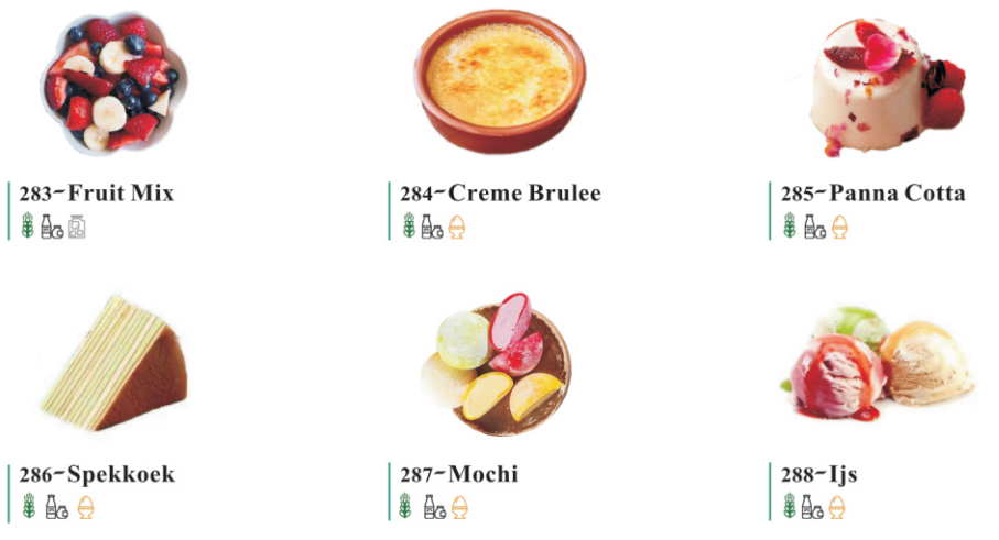
283-Fruit Mix 284-Creme Brulee 285-Panna Cotta 286-Spekkoeke 287-Mochi 288-Ijs