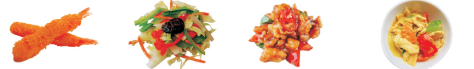
272-Ebi Fry/gefrituurd garnaal 2st. 273-Vegetables /veggie mix 274-Sweet Sour Chicken /gepaneerde kipfilet in zoetzuur saus 275-Curry Chicken /kipfilet met kerrie saus