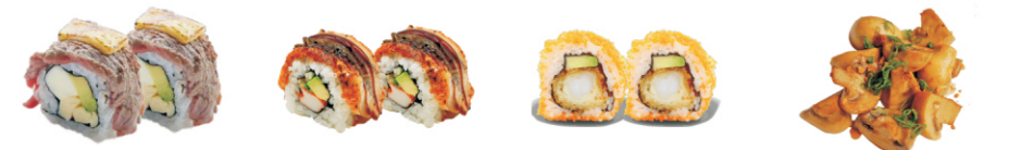
260-Beef Cheese avocado omelet roomkaas en geflambeerde beef&kaas 261-Unagi Maki avocado omelet roomkaas met topping van paling 262-Ebi Tempura gefrituurde ebi fry en tempura&tobiko 263-Mushrooms/ champignons met teriyaki saus