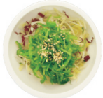
203-Wakame Salad zeewier salade