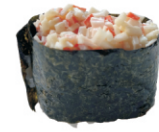
222-Crab Salad /krabsalade